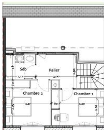
PLAN ETAGE 1er