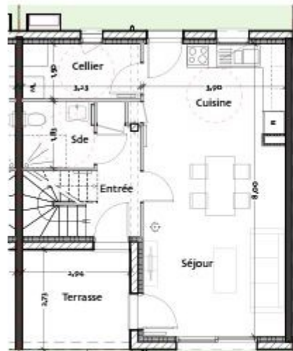
PLAN REZ DE CHAUSSEE