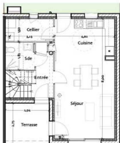
PLAN REZ DE CHAUSSEE