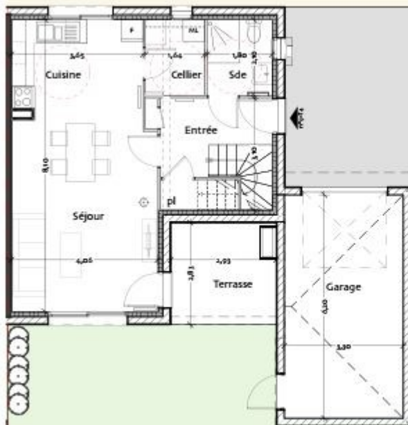
PLAN REZ DE CHAUSSEE